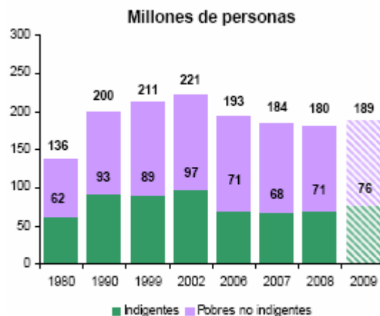
América Latina: evolución de la pobreza y la indigencia a/, 1980-2009

Fuente: Panorama Social de América Latina, 2009.